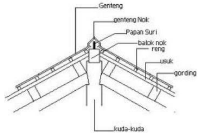
Gambar 1. Konstruksi Rangka Atap Kayu

Konstruksi atap rangka kayu memiliki elemen-elemen kuda-kuda, gording, kasau/usuk, reng dan penutup atap.