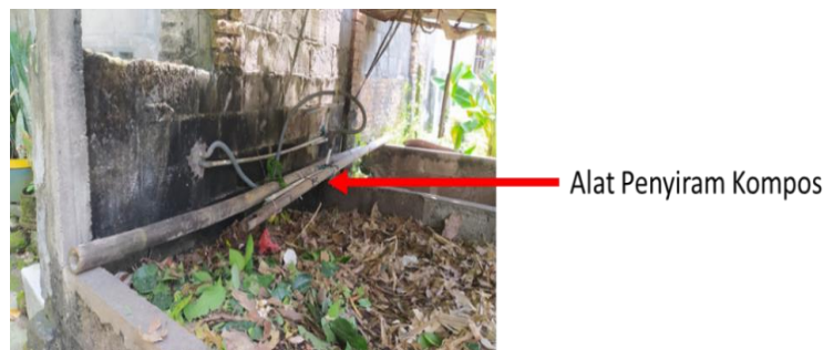
Gambar 5. Penyiraman Kompos

Dalam proses pematangan dilakukan pengadukan serta penyiraman. Pengadukan dilakukan 1 bulan sekali, Selama proses dekomposisi atau penguraian massa kompos akan berkurang sebesar 35%-45% berat basah dan 50% berat volume. Pada waktu pertengahan menjelang akhir dari durasi pematangan, kondisi dari calon kompos mulai menjadi kering yang dikarenakan kelembapan dari kompos terus berkurang setiap harinya yang disebabkan kadar air melalui tiap harinya terevaporasi (menguap). Maka dari itu penyiraman akan dibutuhkan yang bertujuan agar calon kompos tetap dalam kondisi lembab yang merupakan tempat berkembang biaknya para mirkroorganisme pengurai.