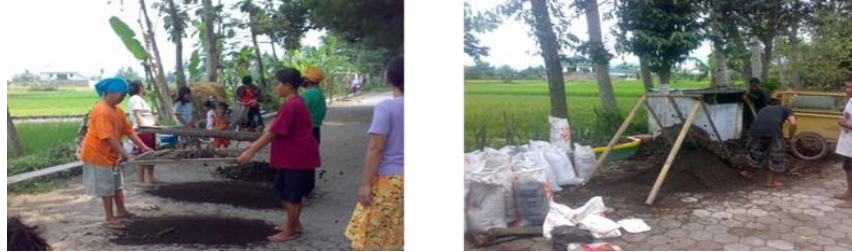
Gambar 6. Pengayakan Kompos

dengan menggunakan mesin pengayakan. Pengayakan dilakukan masyarakat Desa Sukunan menggunakan ayakan biasa, agar hasil yang diperoleh maksimal.