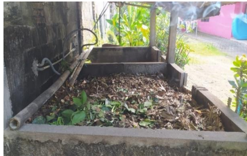
Gambar 4. Proses Pencampuran Bahan