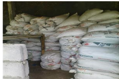
Gambar 7. Pengemasan Kompos