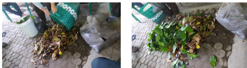
Gambar 1. Bahan Kompos

Pada tahapan pertama ini, bahan yang dikumpulkan adalah sampah organik seperti daun kering, sampah sisa makanan dan sampah sisa buah-buahan. Pembuatan kompos di Desa Sukunan lebih banyak menggunakan campuran bahan dari daun kering dan daun basah. Juga dicampurkan kotoran hewan ternak yang sudah menjadi tanah.