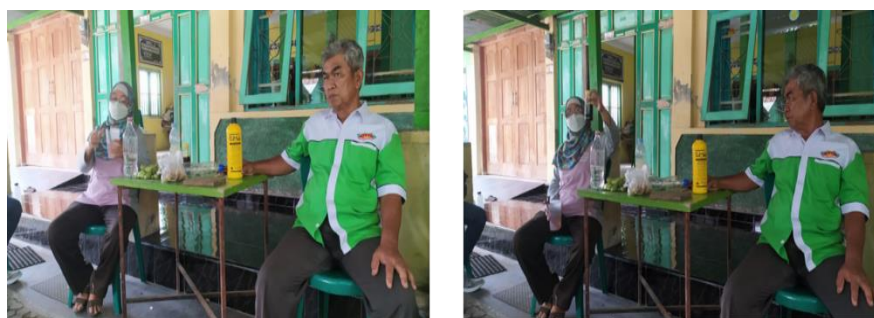
Gambar 2. Pembuatan Activator Organik