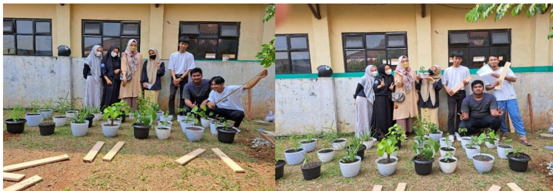
Gambar 1. Kegiatan pelaksanaan pengabdian kepada masyarakat

Penanaman apotek hidup memiliki dampak positif dari segi kesehatan dan ekonomis. Dari segi kesehatan, masyarakat dapat menggunakan apotek hidup sebagai obat herbal dan mengurangi ketergantungan terhadap obat kimia. Dari segi ekonomis, masyarakat dapat berwirausaha melalui wirausaha obat herbal. Apotek hidup dijadikan sebagai sarana peningkatan ecoliteracy pada masyarakat., sehingga masyarakat peka terhadap isu-isu yang terjadi di lingkungan alam sehingga adanya pembangunan yang berkelanjutan. Ecoliteracy dapat membantu seseorang lebih tanggap terhadap lingkungan dan permasalahannya sehingga dapat mengurangi dampak pencemaran lingkungan serta memberikan manfaat jangka panjang bagi lingkungan (Suryanda et al., 2019).