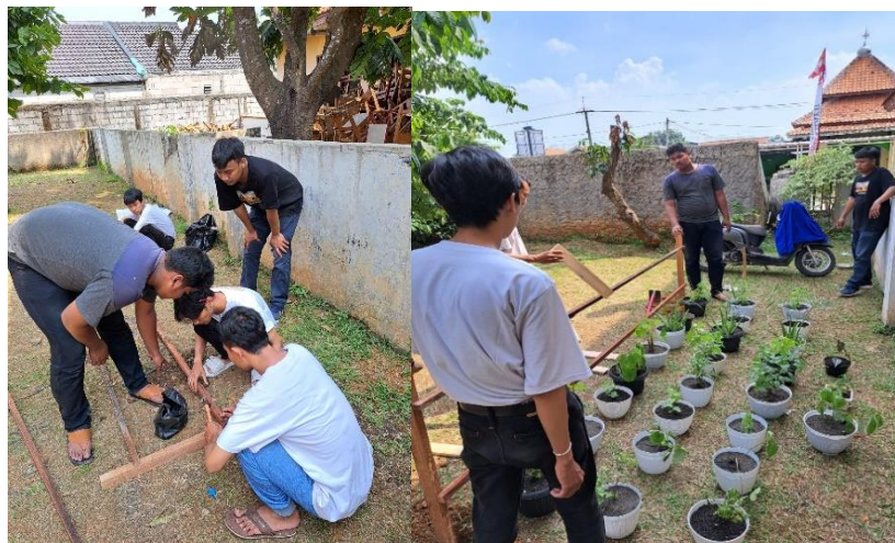
Gambar 2. Penanaman Apotek Hidup

Peningkatan ecoliteracy masyarakat dapat dilihat dari indikator 1) memiliki pengetahuan dasar dan prinsip ekologis; 2) mampu menganalisis permasalahan lingkungan; 3) mampu memberikan solusi terhadap permasalahan lingkungan; 4) memiliki kepedulian terhadap sesama manusia dan lingkungan; 5) bertanggungjawab menjaga lingkungan; dan 6) bijaksana dalam menggunakan sumber daya alam. Keenam indikator tersebut dijadikan indikator untuk melihat peningkatan ecoliteracy masyarakat sebelum adanya kegiatan apotek hidup dan sesudah kegiatan apotek hidup.