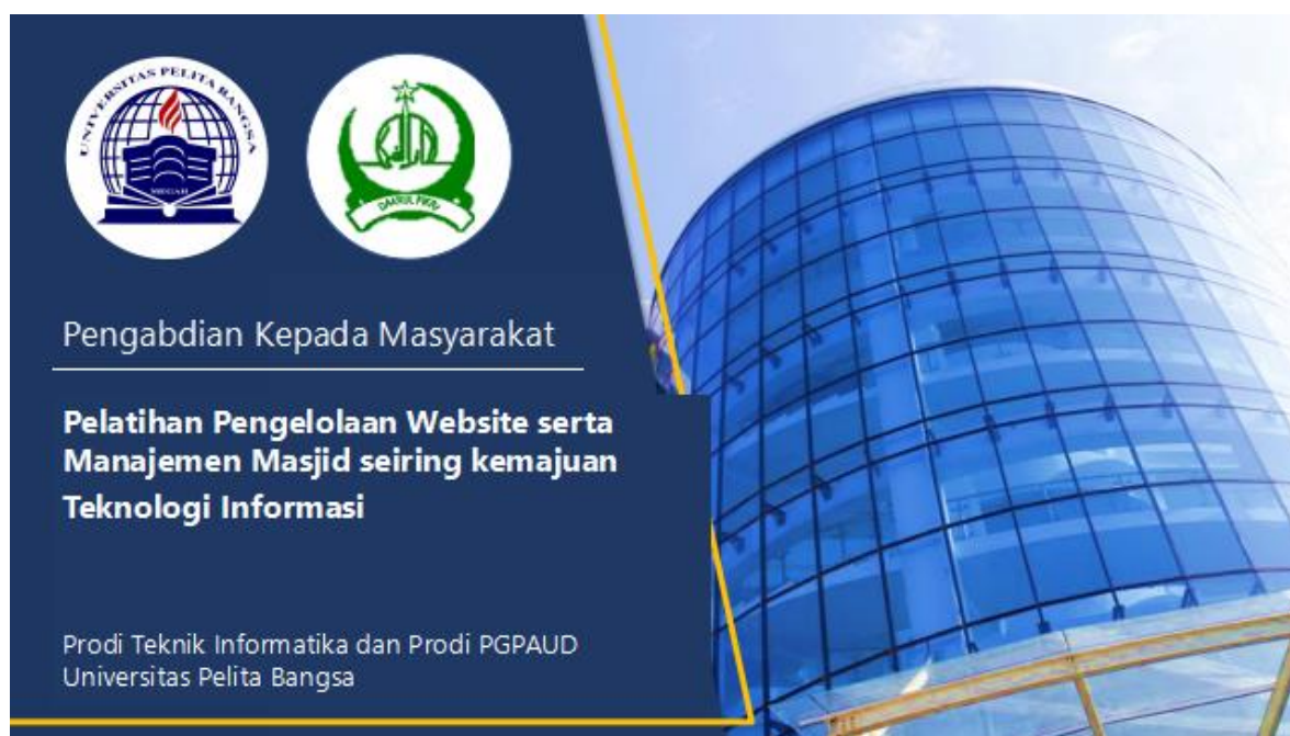
Gambar 1 : Pembukaan Pelatihan.

Pelaksanaan Kegiatan Pengabdian Kepada Masyarakat yang dilakukan dengan melakukan pelatihan pengelolaan website dan praktek pada hari Jumat tanggal 27 Januari 2023 di Masjid Daarul Fiiikri. Pelatihan yang diadakan di Masjid Daarul Fiiikri. tentang pengelolaan manajemen masjid serta penggunaan dan pengelolaan website telah mendapat tanggapan yang positif dari Pengurus Masjid Daarul Fiiikri yang mengikutinya.