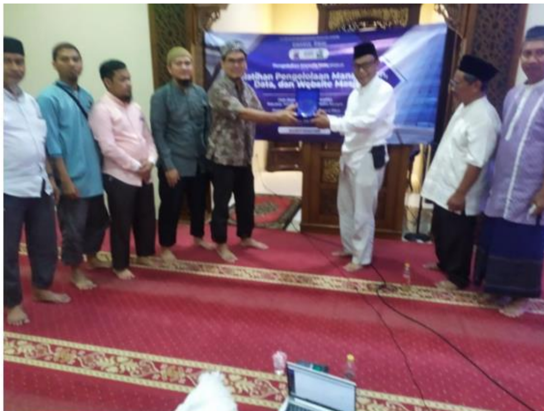
Gambar 4 : Penyerahan Plakat Penghargaan.