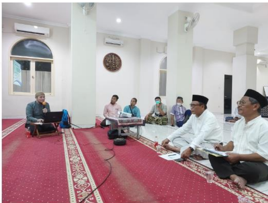
Gambar 5 : Kegiatan Pelatihan Manajemen Masjid dan Pengelolaan WebsitenMasjid