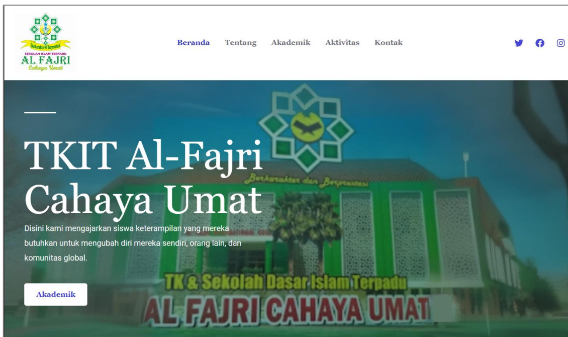
Gambar 2. Tampilan Halaman Beranda Website di Laptop