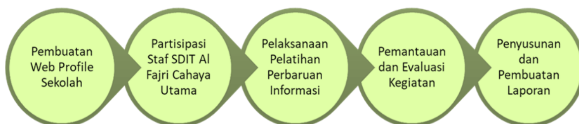
Gambar 1. Metode Pembuatan Profil

Skema penyelesaian masalah dengan kegiatan PKM pada mitra TKIT Al-Fajri Cahaya Umat di Kecamatan Cikarang Timur adalah sebagai berikut: