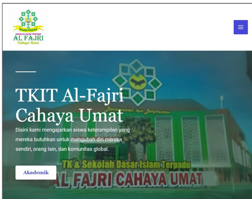
Gambar 3. Tampilan Halaman Beranda Website di Tablet