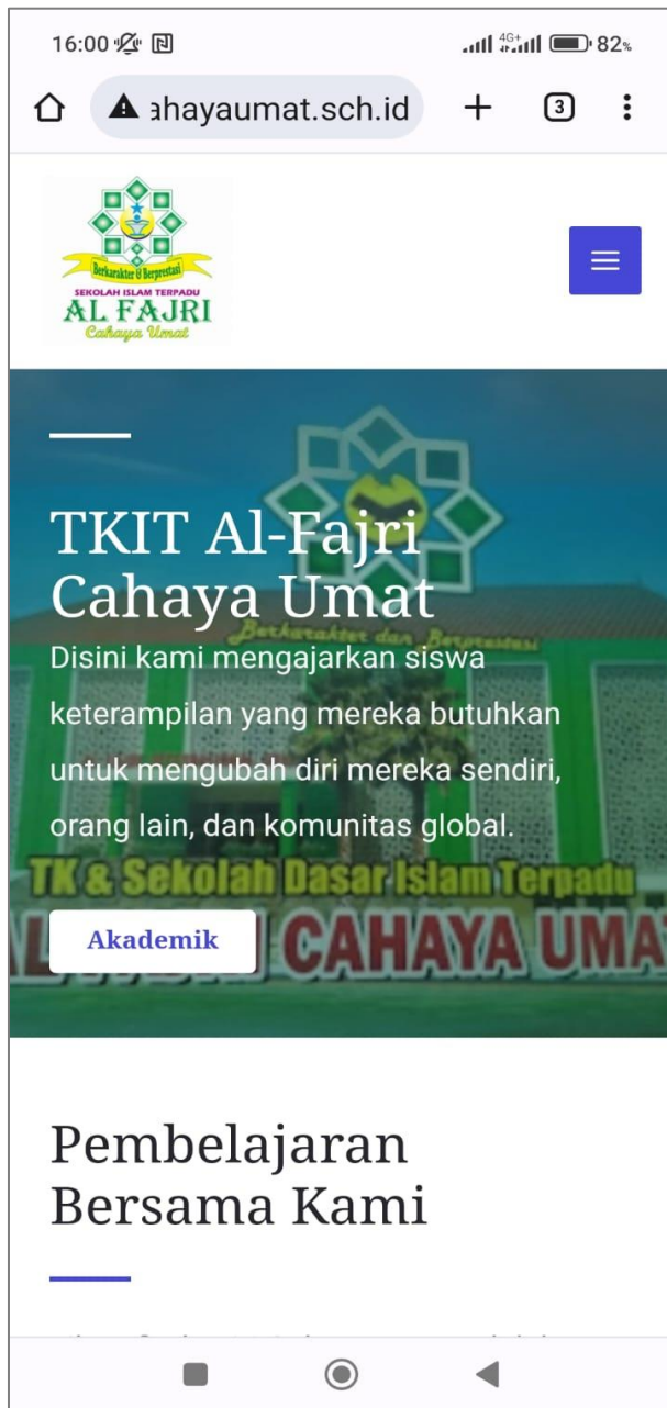
Gambar 5. Tampilan Halaman Beranda Website di Handphone