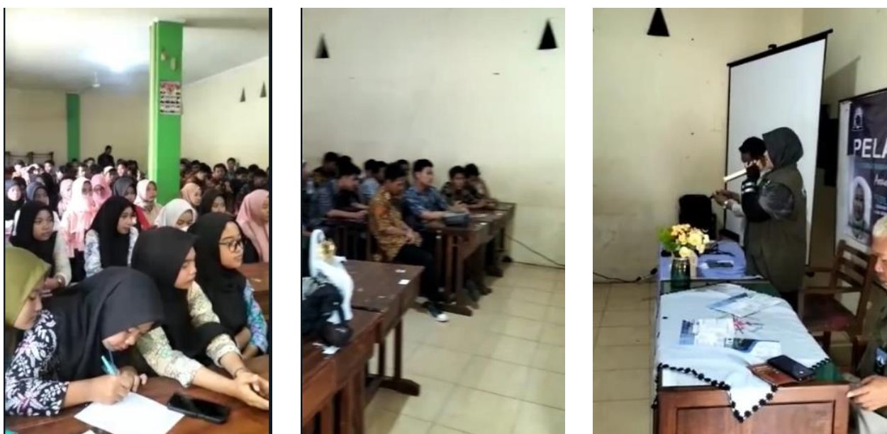
Gambar 1. Suasana Pelatihan